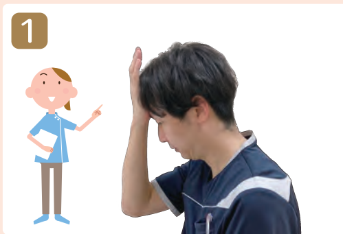
1 軽く下を向き、手の付け根を額に当てます

今回はその中でも自宅で簡単にできる「嚥下おでこ体操」を紹介します。嚥下おでこ体操は、飲み込み=嚥下に必要な筋肉を鍛える運動です。