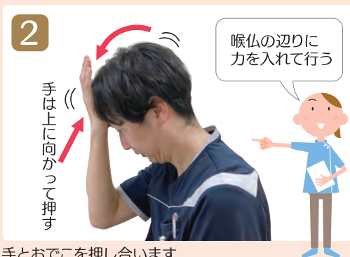
2 手とおでこを押し合います