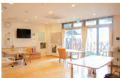
▲中庭を臨む明るいリビング

例えば、利用者さまが今日できなかったことが次の日にできたり、介助の仕方がスタッフによって違ったりすることがあるので、どんな些細なことでも毎日記録に残し、スタッフ間で情報共有できるようにしています。この積み重ねを行うことにより、質の高いケア体制が構築できています。