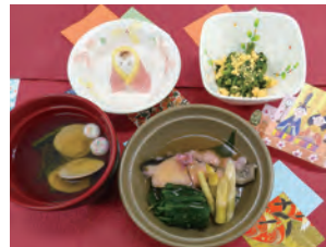
▲3月 ひな祭り「桜蒸し」