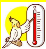
温度・湿度を低め調整