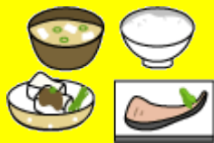
バランスのとれた食事