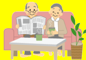
感染症流行時には自宅待機