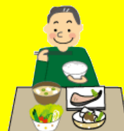
調理後すぐに食べる