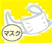
くしゃみ・咳にはマスク