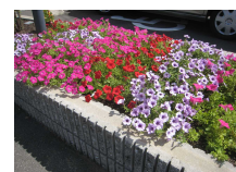
当院敷地内の花壇です。