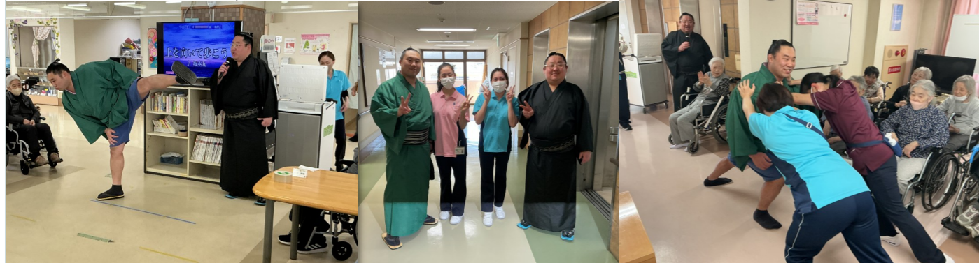
二人がかりで押し相撲