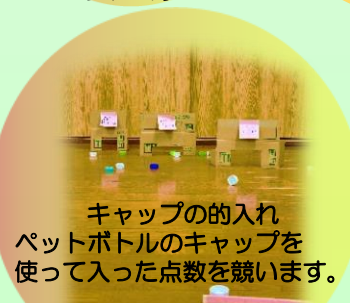
キャップの入れ ペットボトルのキャップを 使って入った点数を競います。