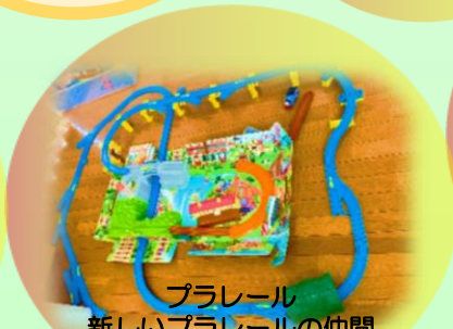
プラレール 新しいプラレールの仲間 が増えました。