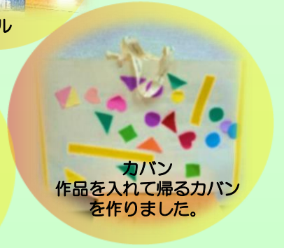
カバン 作品を入れて帰るカバン を作りました。