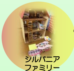
シルバニアファミリー